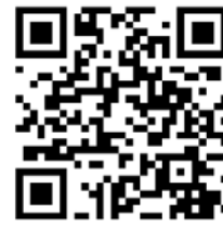
城市科學實驗室官網